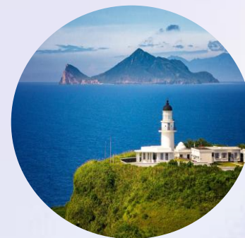
台湾地区 教育资源延伸