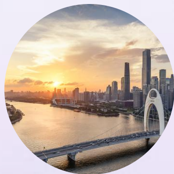
大湾区 项目快速落地